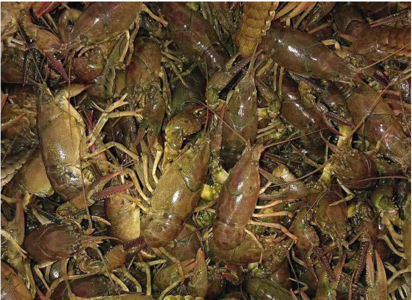
Abbildung 2: Kalikokrebse aus einem Kleingewässer

In einem etwa 100 m entfernten Gewässer, welchem der Name Dreizack gegeben wurde und das auf der anderen Seite der Holzlachsclut liegt, konnten zwischen Oktober 2014 und April 2015 6.077 Kalikokrebse gefangen werden, darunter mehr als 2.042 eiertragende Weibchen. Im Mai 2015 schlüpften in diesem Gewässer viele Libellen, Armleuchteralgen bildeten Rasen am Grund und Molchlarven waren zu finden. Das Gewässer schien saniert. Jedoch im Juli 2015 war auch dieses Gewässer für Amphibien und Libellen verloren. Es war nicht gelungen, alle eiertragenden Weibchen zu fangen beziehungsweise eine neue Zuwanderung zu verhindern. Die Jungkrebse wuchsen in dem flachen, nahrungsreichen Wasser schnell heran und im August 2015 waren die ersten aktuell geschlüpften Exemplare bereits geschlechtsreif. Durch sinkende und anhaltend niedrige Wasserstände war es möglich, dort zwischen dem 28. Juni und dem 20. August 2015 sehr effektiv Krebse zu fangen. Die Gesamtzahl für den Zeitraum betrug 21.084 Exemplare.